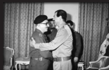
Saddam e Tariq Aziz

cos xiitas do Irã. Não procuremos imaginar o que se passou nos momentos em que as câmeras de vídeo e máquinas fotográficas não estavam acionadas. Seria duro demais. Deixemos este mérito a Saddam, que não imaginou e nem sequer sonhou com tal cena de horror, mas a viveu.