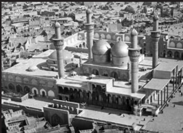
Local do enforcamento

O réu inspira uma autoridade inexplicável perante seus algozes em situação tão insólita. O mesmo deveria estar também encapuzado se tivesse se submetido à tradição usual conferida a todo condenado à força a fim de ocultar o terror que normalmente se apossa, de forma incontrolável, dos seres que têm que passar por esta trágica morte. Mas esse homem é diferente: ele pede para que seu rosto não seja coberto. Tendo sido líder de seu povo por quase três décadas, quer deixar gravado seu último ato de coragem e de confiança como exemplo e prova da sua firmeza de caráter, partindo desse mundo com a cara e o coração limpos.